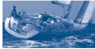
Sun Odyssey 42 DS