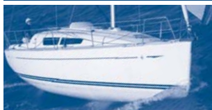
Sun Odyssey 30i