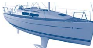
Sun Odyssey 33i